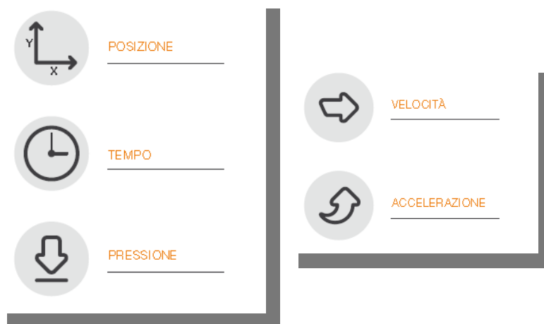
Fig.1 - Schema

Gli elementi disponibili nell'apposizione della sottoscrizione da parte del FIRMATARIO , sono i dati biometrici e comportamentali, quali: Posizione della penna, Pressione, Tratto in aria (percorso che fa la penna quando non tocca nel device, fino a 1cm ), e Tempo. E' possibile elaborare velocità e accelerazione ai fini di analisi forensi.